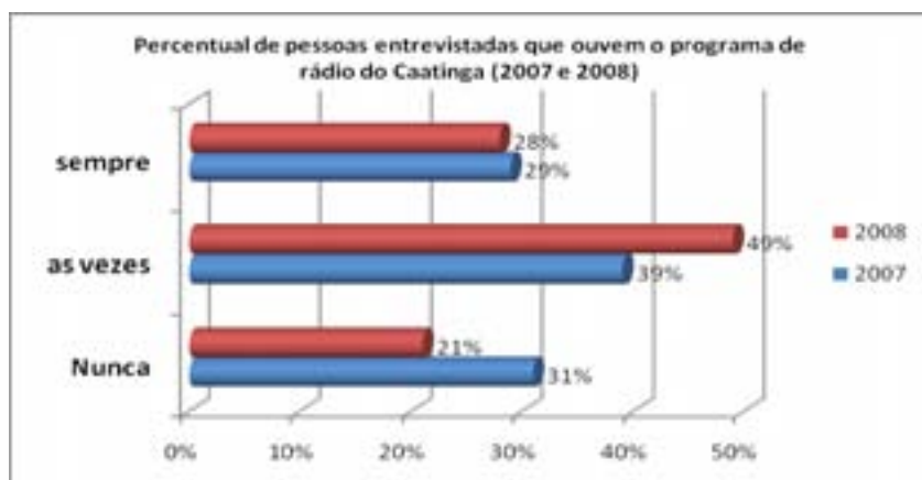
Gráfico 2 – Evolução da audiência programa de rádio entre 2007 e 2008

Quanto à participação nos fóruns de proposição de políticas públicas, o Caatinga tem conseguido ampliar sua influência nos níveis local, regional, estadual e nacional: