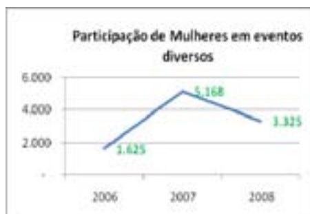
Gráfico 3- Mulheres em eventos

É considerável o crescimento da participação das mulheres como mostra o Gráfico 03 no conjunto das atividades desenvolvidas pelo projeto. Nos eventos de formação a presença das mulheres oscila entre 45% e 50% com uma forte participação especialmente no segundo ano. No terceiro ano há uma queda devido a um número menor de eventos.